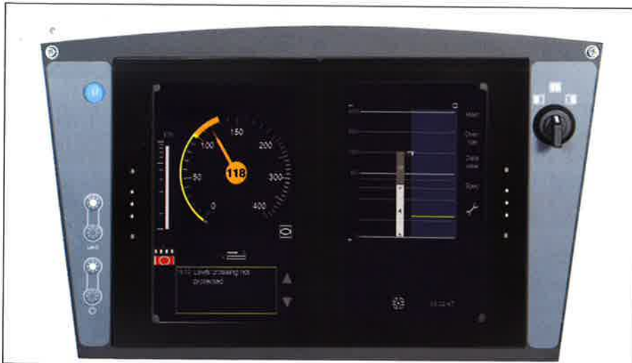
Zwei redundante Displays erzeugen eine Gesamtoberfläche von 10,4 Zoll

Anzeige- und Eingabeverhalten des DMI sind im Subset-091 streng normiert. Die Responsezeit nach der Eingabe und die Darstellung der grafischen Objekte sind auf 20 ms limitiert. Die Wahrscheinlichkeit eines Eingabefehlers von Fahrzeugdaten und Parametern muss für den Fahrer minimiert werden. Und auch hier gibt es wieder einen zeitlichen Richtwert: Innerhalb von 60 Sekunden muss das DMI für die Dateneingabe aus dem Standby-Modus bereit stehen. Dabei muss jederzeit sichergestellt werden, dass der Triebfahrzeugführer seine Arbeit zügig und fehlerfrei ausüben kann, ohne die Komplexi-